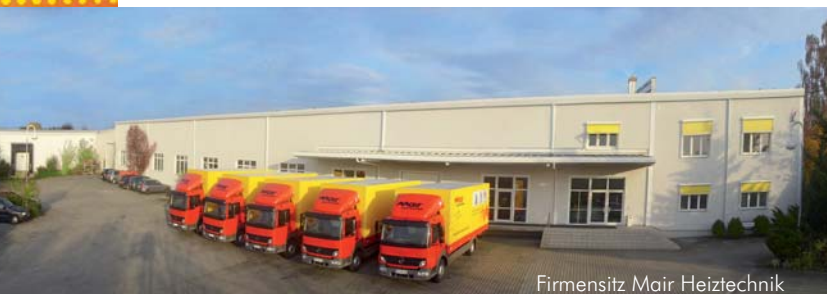
Firmensitz Mair Heiztechnik